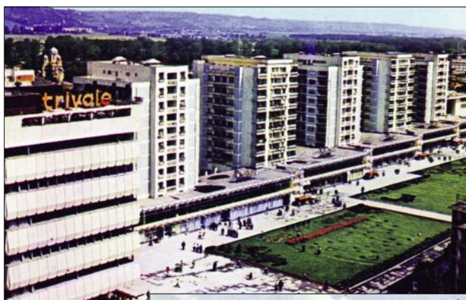
Centru, Magazinul Trivale