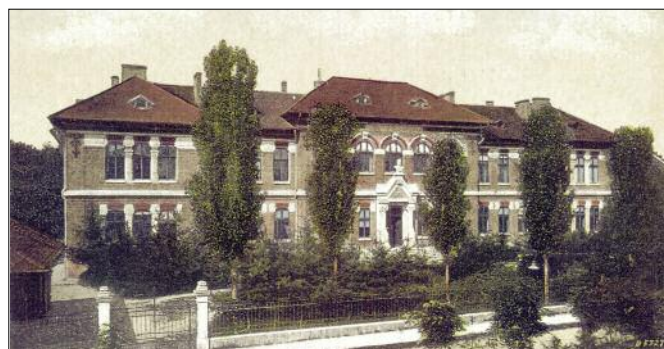
Colegiul Național I.C. Brătianu