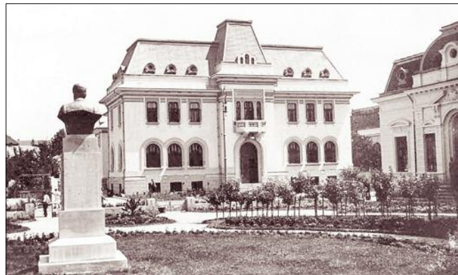
Strada Craiovei, Prefectura - 1975

Melancolie este cuvântul care ne caracterizează starea privind aceste minunate fotografii de arhivă, publicate pe site-ul Primăriei Municipiului Pitești. Multă verdeață, trafic puțin, aglomerație redusă... Clădirile se impuneau ușor în raport cu construcțiile Piteștiului de altădată. În prezent, vorbim de clădiri colosale, moderne, autoturisme performante, informații on-line, tehnologia ne ghidează la fiecare pas, iar evoluția se trăiește individual, dar și în comun, potrivit imaginilor actuale ale municipiului. Dezvoltarea și-a spus cuvântul, dar ne face plăcere de fiecare dată să ne amintim cum arăta orașul reședință de județ în urmă cu 30-40 de ani. Acestea sunt doar câteva repere care au rezistat peste timp și care reprezintă și astăzi imobile de referință pentru piteșteni.